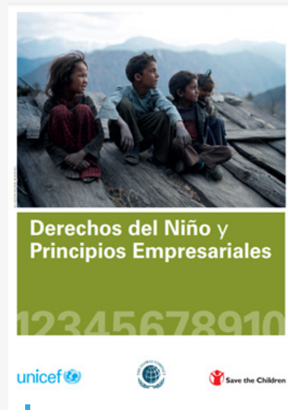
Derechos del Niño y Principios Empresariales