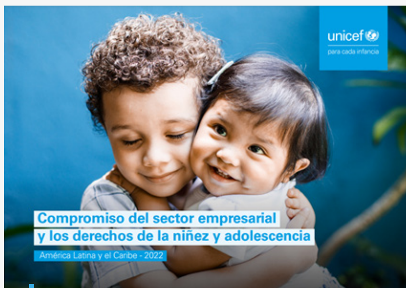
Compromiso del sector empresarial y los derechos de la niñez y adolescencia