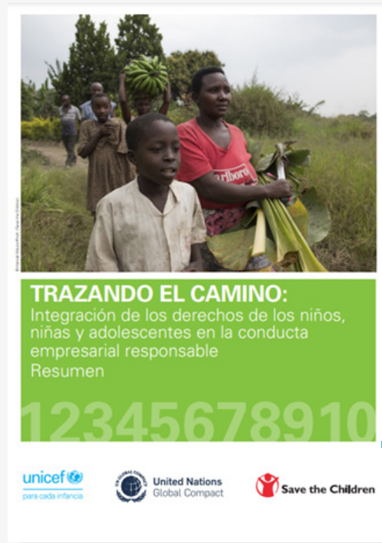
Trazando el camino: Integración de los derechos de los niños, niñas y adolescentes en la conducta empresarial responsable